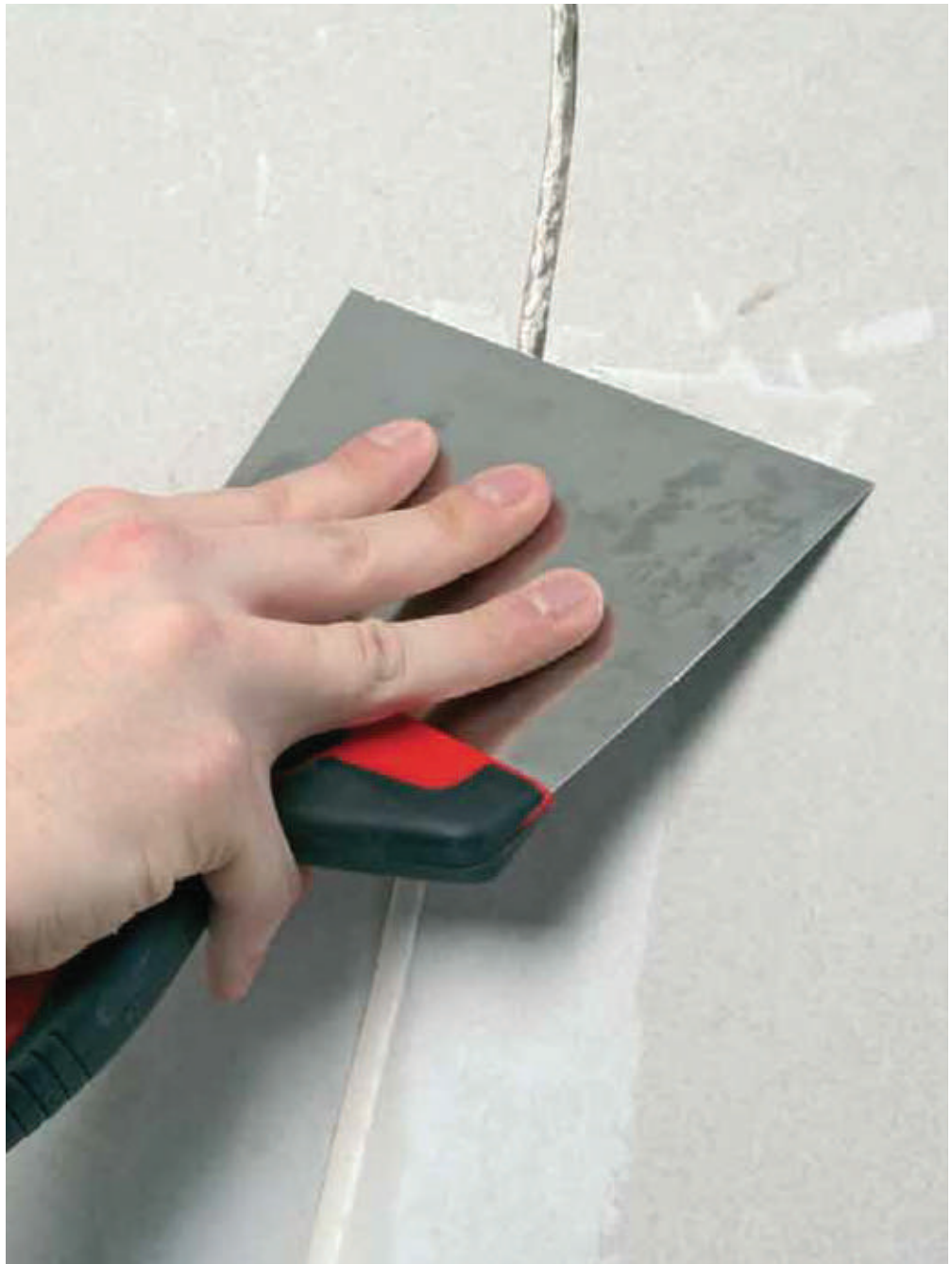
Enduit pour joints de plaques de plâtre

Qualité assurée Marque et produit déposée