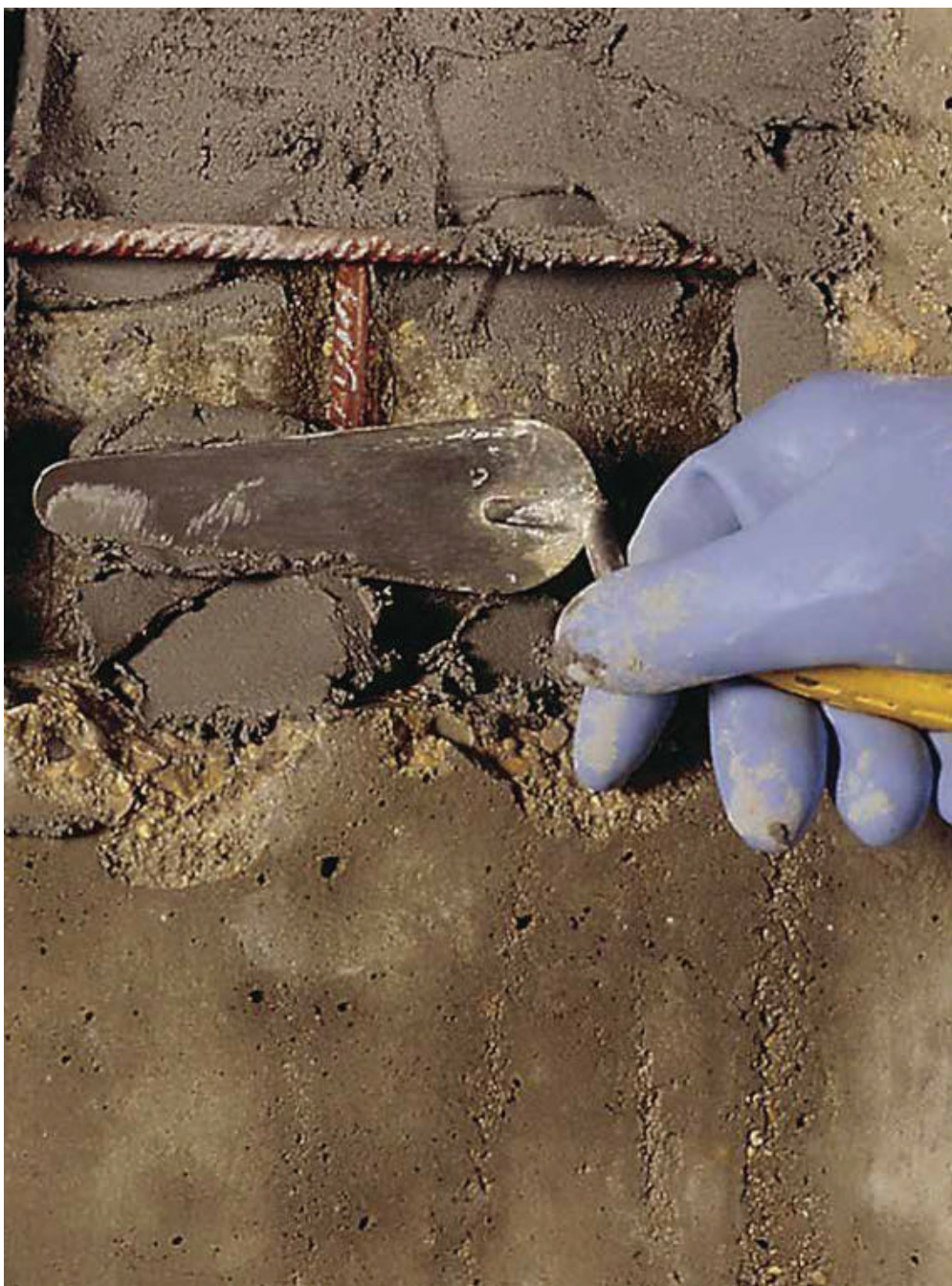
Mortier De Réparation Mono-composant Renforcé Par Des Fibres Synthétiques De Hautes Performances

Qualité assurée Marque et produit déposée