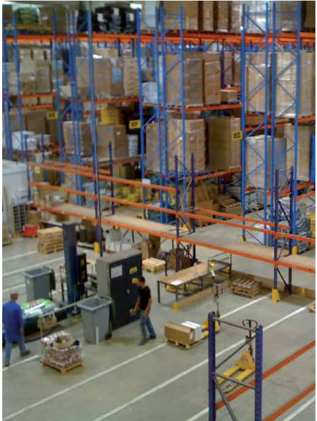
Couche d'usure à haute dureté pour les sols industriels soumis aux trafics sévères

Qualité assurée Marque et produit déposée